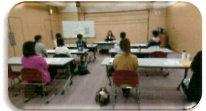
ゆったり間隔をあけて安心です。