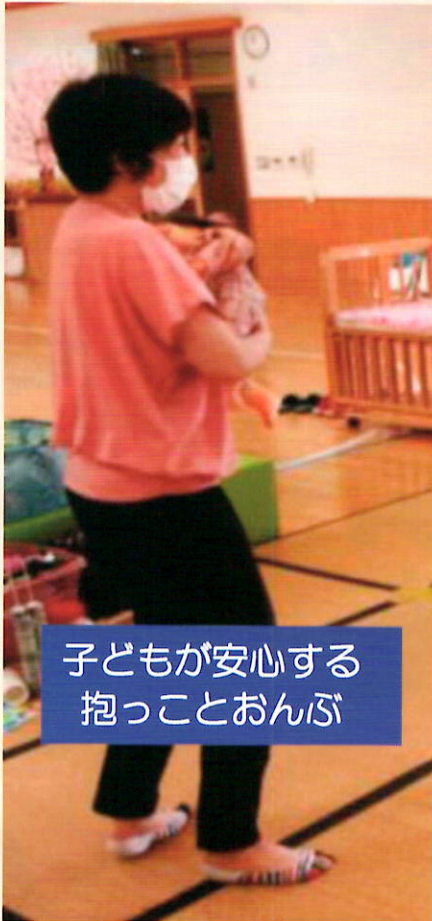
子どもが安心する 抱っことおんぶ