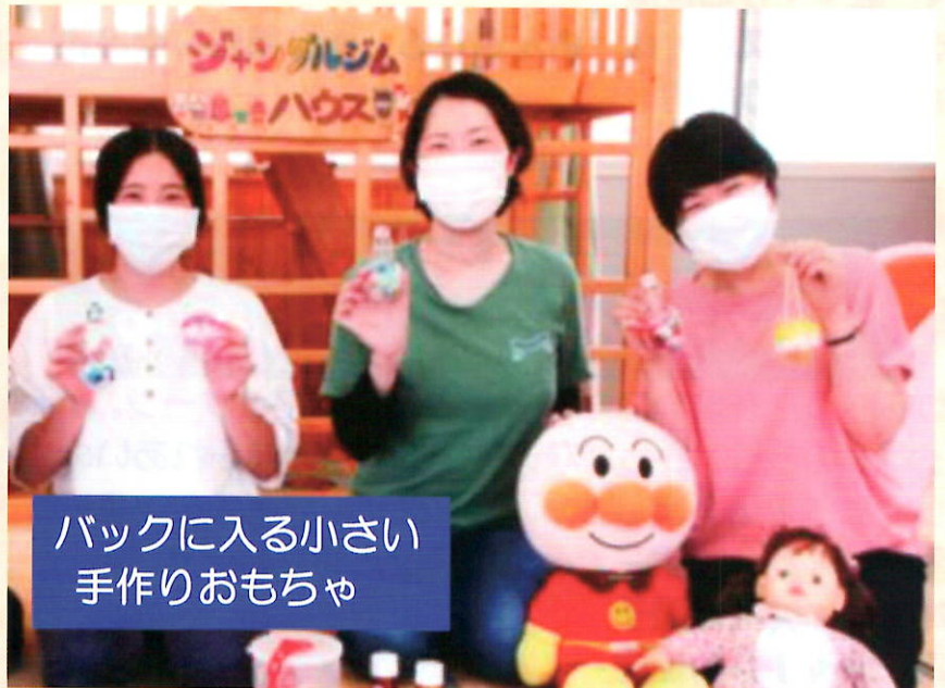
バックに入る小さい 手作りおもちゃ