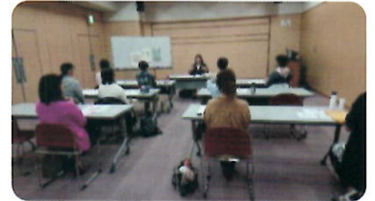
ゆったり間隔をあけて安心です。