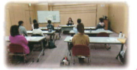
ゆったり間隔をあけて安心です。