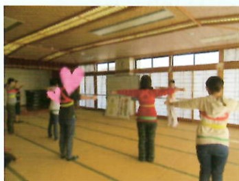
女性部の学習会、子育てママ、介護施設などたくさんの方々に喜ばれております

講座開催時は手指消毒、マスクまたはフェイスシールドを着用いたします。 3蜜（密閉空間、密集場所、密接場面）に気を付けながら開催してまいります。