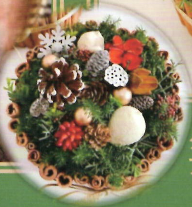
クリスマスケーキのような アレンジメント

生花の場合 材料費 3,500円 お花の日持ちは7日～10日程度 (プリザーブドフラワーに変更すると5年程度飾ることが出来ます) 直径 約20cm 高さ 約7cm 高級感たっぷりの深紅のバラがクリスマスパーティーにおすすめです。