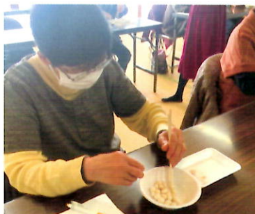
利き手と反対の手を使って 脳の活性化