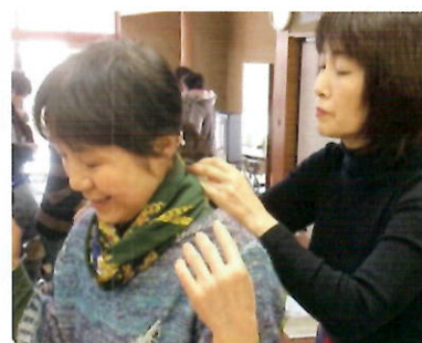
笑顔が咲く スカーフ・ストールの巻き方