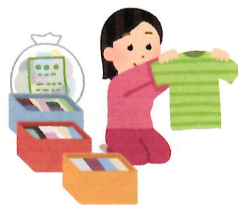
片付け上手は暮らし上手