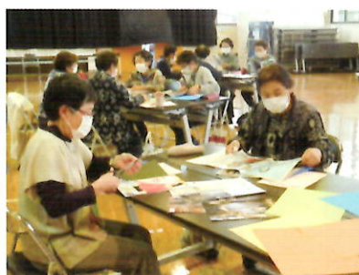
楽しくコラージュ作りで 着ていない服を着るきっかけに

快適な生活への近道は「片付け」です。もったいない精神も大事に再利用についても考えます。