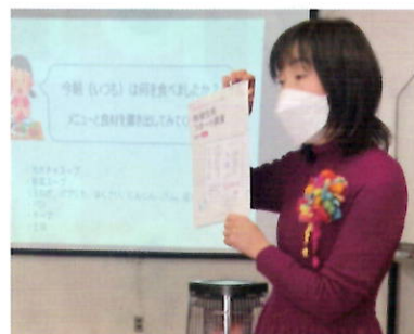
タンパク質は 朝に多く摂ったほうが筋力UP！