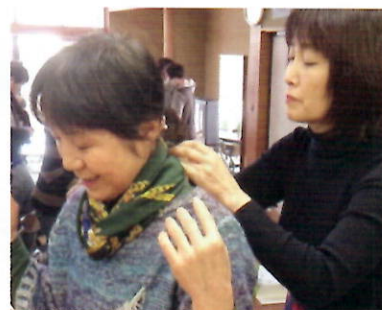
笑顔が咲く スカーフ・ストールの巻き方