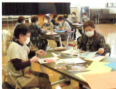
コラージュ作りで 着ない服を着るきっかけに

快適な生活への近道は「片付け」です。もったいない精神も大事に再利用についても考えます。