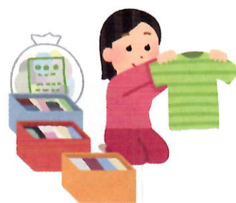
片付け上手は暮らし上手