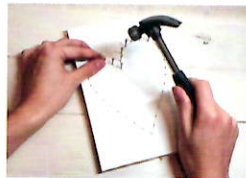
下書きに合わせて クギを打つ