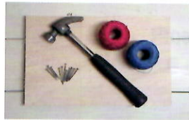
木板・クギ・糸 かなづち

木の板にクギを打ち、糸を自由に巻き付けていくだけで、立体的な飾り物ができあがります。