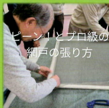
ピン！とプロ級の 網戸の張り方