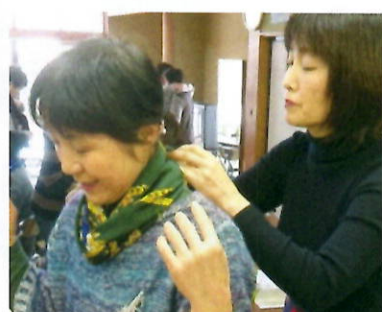
笑顔が咲く スカーフ・ストールの巻き方