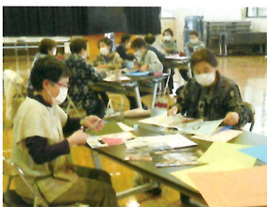
楽しくコラージュ作りで 着ていない服を着るきっかけに

快適な生活への近道は 「片付け」です。 もったいない精神も大事に 再利用についても考えます。