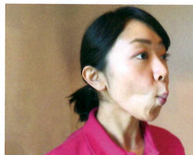
②頬の筋肉を意識しながら 唇をすぼめて5秒キープ