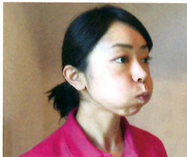
①唇を閉じて頬に空気を入れ、 5秒キープし吐き出す