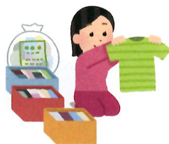
片付け上手は暮らし上手