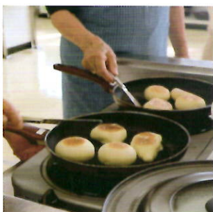
フライパンでパン