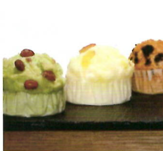
地域の米粉使用 蒸しパン