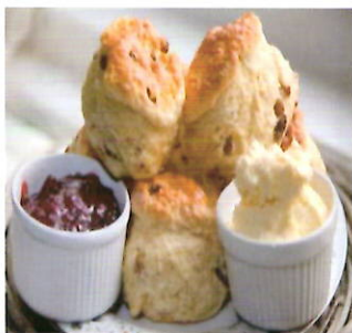
紅茶とスコーン作り