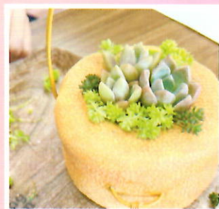
【モルタルのバスケット鉢作り】 ¥4,500